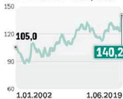
Poziom detalicznych cen mięsa drobiowego wobec poziomu z 2002 r. (2002=100)