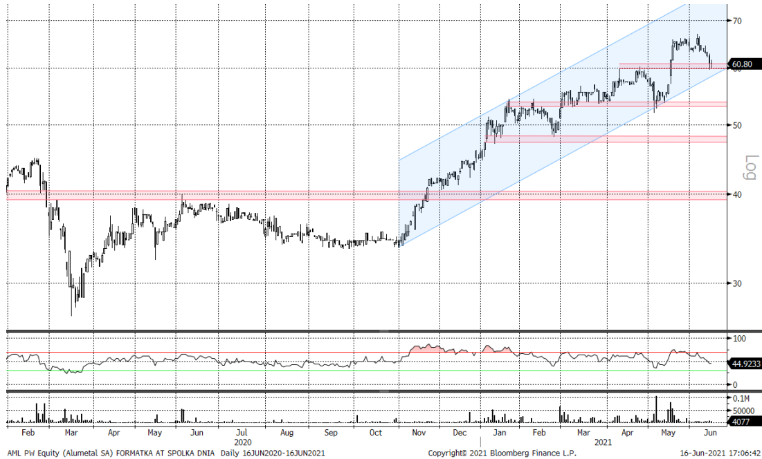
AML PH Equity (Alumetal SA) FORMATA AT SPOLKA DNIA Daily 16JUN2020-16JUN2021 Copyright 2021 Bloomberg Finance L.P. 16-Jun-2021 17:06:42